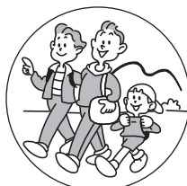
旅行など環境の変化で おなかの調子をくずしたときに