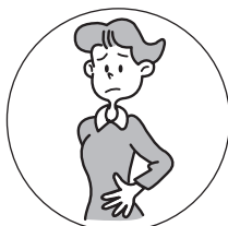
おなかが はったときに