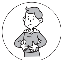
おなかの弱い方の 整腸に